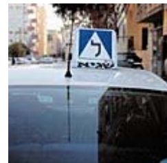
המורים לנהיגה טורטרו בין המעסיקים (צילום אילוסטרציה)

בסופו של דבר, תבעו המורים, באמצעות עורכי הדין שלומי תורג'מן ואיל רעני ממשרד אפיק תורג'מן, גם את ל.ה.ט.ם, גם את חברת "בילינסון יצחק בע"מ" שבבעלות בילינסון וכן את כל חברות הנהיגה האחרות שבבעלות וינגוט: א.א. בי"ס ארצי לתחבורה, בית הספר הארצי לנהיגה ת"א ("שמוליק") ו"אדם הבשן".