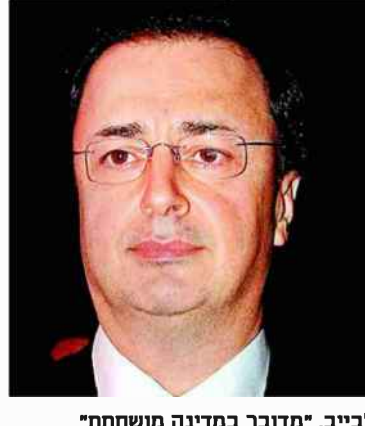
לבייב. "מדובר במדינה מושחתת"

"לאור המצב הנוכחי בקירגיסטאן", עוד מדות שתי הצעות של קבוצת לבייב על הפרק, כאשר לפי אחת מהן, המשקיע או המטעמו (הכוונה לקבוצת לבייב - ע"ר) ינהל מו"מ עם הגורם המנסה להשתלט על החברה, ויהיה רשאי להציע לו עד