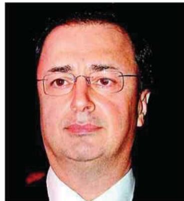
לבייב. "מדובר במדינה מושחתת"

"לאור המצב הנוכחי בקירגיסטאן", ער"דות שתי הצעות של קבוצת לבייב על הפרק, כאשר לפי אחת מהן, המשקיע או מטעמו (הכוונה לקבוצת לבייב - ע"ד) ינהל מו"מ עם הגורם המנסה להשתלט על החברה, ויהיה רשאי להציע לו עד